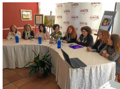
Otra imagen de la edición anterior.