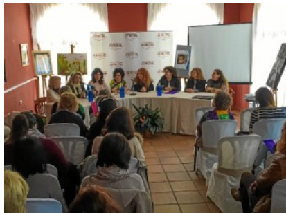
Acto de inauguración del año pasado.