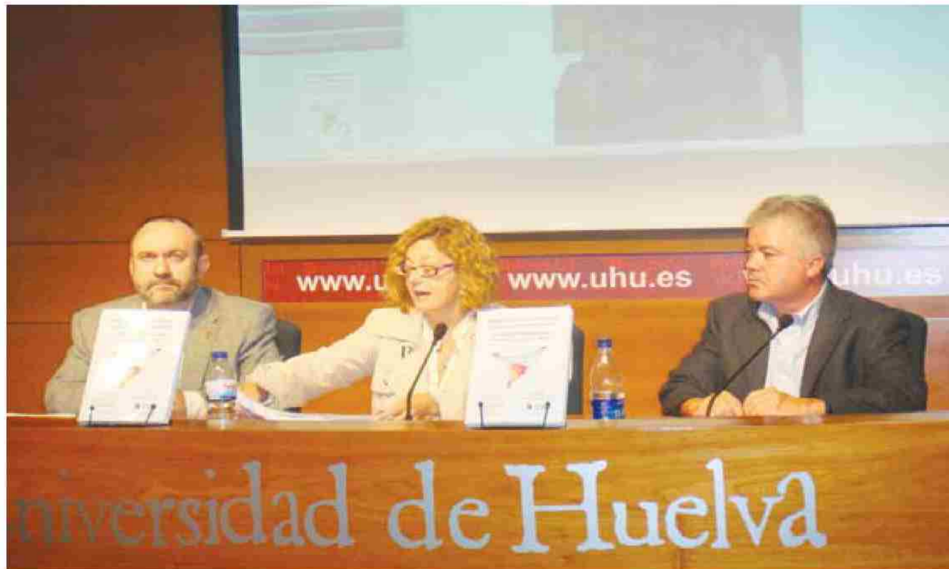
Presentación del libro sobre las migraciones España-Brasil. VH

Estas son algunas de las conclusiones incluidas en el libro 'Migraciones Iberoamericanas/ Las migraciones España - Brasil', presentado este lunes en la Universidad de Huelva y coeditado por el Centro de Investigación en Migraciones de La Onubense y el Laboratorio de Estudios de Inmigración y Extranjeros (Labimi)